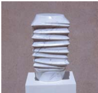
10 - Lumière - 1999 38x22x22 Marbre blanc d'Italie