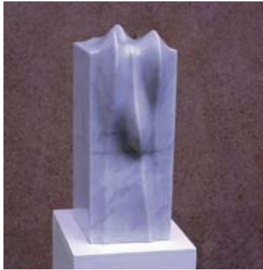
9 - Amitié - 1999 25x13x34 Marbre blanc d'Italie