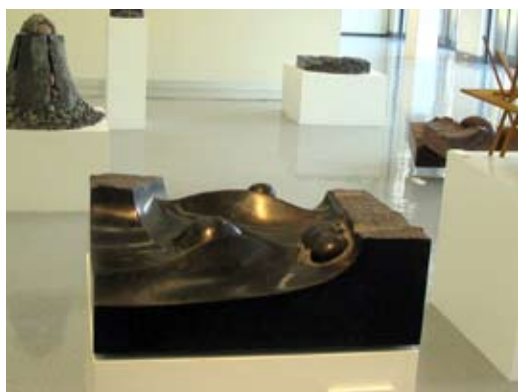
7 - Paysage lunaire - 2001 50x50x20cm Granit noir d'Afrique