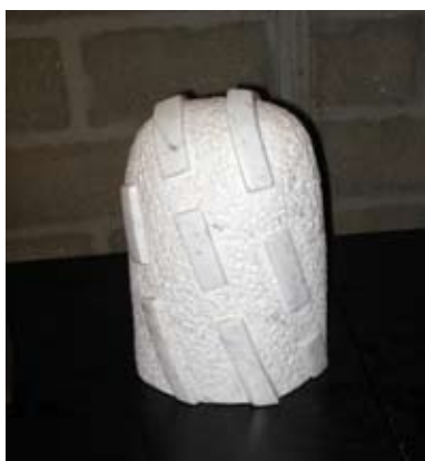
12- Rythme 1 - 2000 25x20x38 Marbre blanc d'Italie