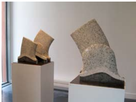
5 - Tricot de la terre - 2006 47x53x56, 53x46x68 Granit et métal