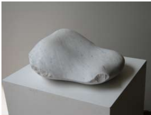
3 - Torse - 2007 39x33x16 Marbre blanc d'Italie