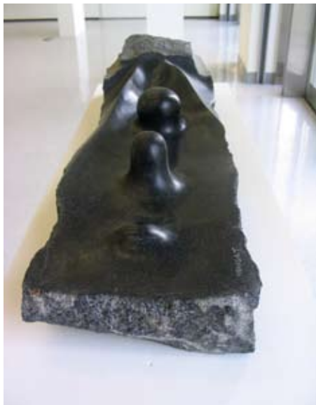
15 - Coulée 2 - 2003 60x16x10 Granit noir