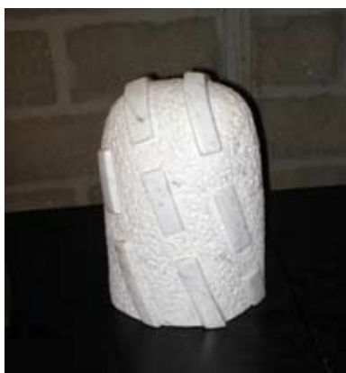
12- Rythme 1 - 2000 25x20x38 Marbre blanc d'Italie