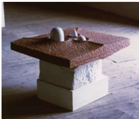
14 - Paysage imaginaire - 1999 70x45x45 Marbre blanc d'Italie et bois acajou