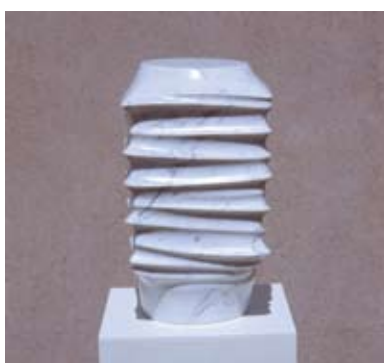
10 - Lumière - 1999 38x22x22 Marbre blanc d'Italie