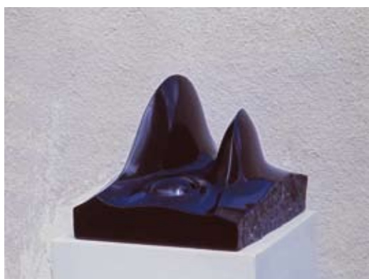
8 - Black mountain - 2000 38x30x34 Marbre noir belge