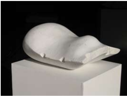
2 - Abdomen - 2007 - 41x31x20 Marbre blanc d'Italie