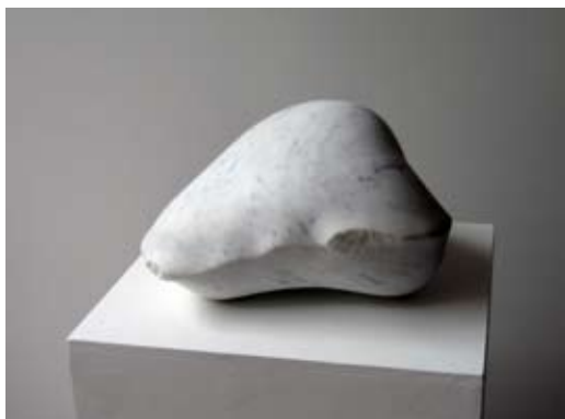
4 - Soulève - 2007 28x29x19 Marbre blanc d'Italie