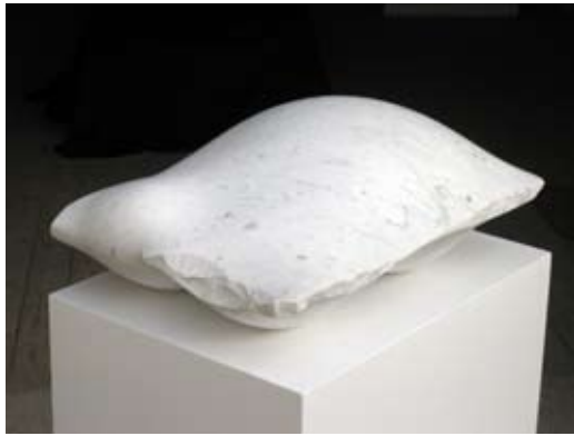
1 - Annonciation - 2007 55x40x21 Marbre blanc d'Italie