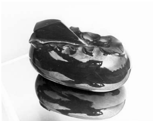
19 - Irruption 3 - 1982 28x15x20 Marbre noir d'Italie