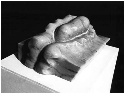
18 - Irruption 2 - 1998 35x28x18 Marbre rose du Portugal