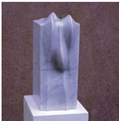
9 - Amitié - 1999 25x13x34 Marbre blanc d'Italie