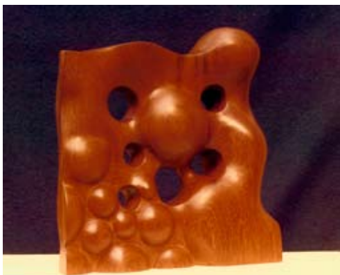
20 - Jeux - 1976 51x56x20 Bois d'Iroko