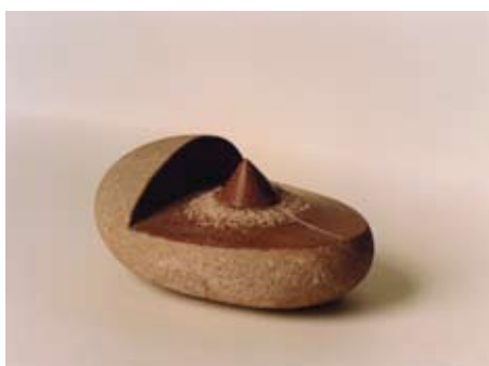
16 - Eden 1 - 1998 24x15x10 Galet du Cap Fréhel