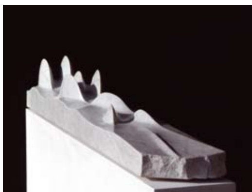
6 - Ondée - 1999 193x25x32cm Marbre blanc d'Italie