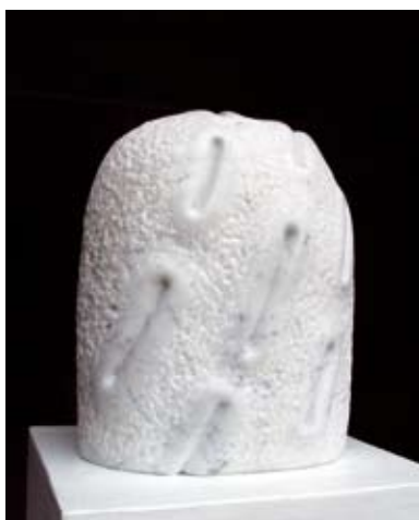
11 - Le songe - 2000 39x26x18 Marbre blanc d'Italie