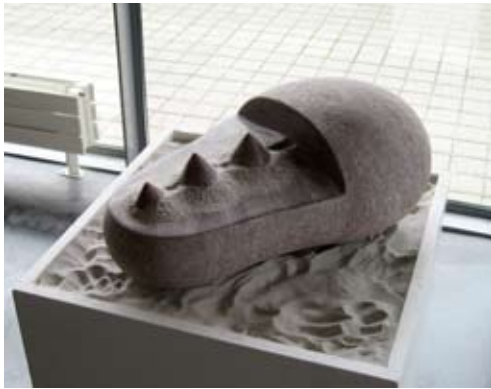
17 - Eden 2 - 1998 39x23x15cm Galet du Cap Fréhel