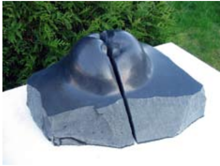
13 - Blessure - 2003 29x53x40 Granit noir de L'Inde